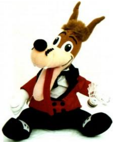
Unser Maskottchen Wolf