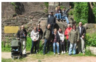
4 Burgenwanderung 2013