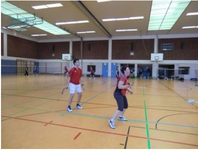
2/3 der Altrheinhalle

Unser Training sowie unsere Spiele und Turniere finden in der Altrheinhalle Lampertheim statt. Die Halle bietet optimale Spielbedingungen: