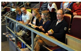
Bitburger Open 2013

Neben den „badmintonbezogenen“ Aktivitäten haben unsere Mitglieder die Möglichkeit, an vom Badmintonverein organisierten Events teilzunehmen.