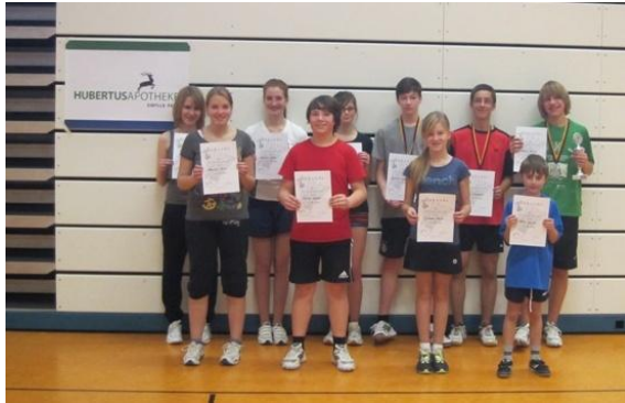
Teilnehmer Jugendturnier 2012